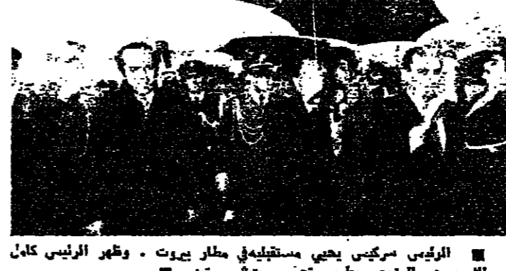
الرئيس سركيس يحيي مستقبليه في مطار بيروت - ويظهر الرئيس كامل الاسعد والوزير طرس تحت شتمسيتين

لا قوات دولية للجنوب والمساعدات العربية على دفعات القاهرة - من عزت صافي . قال ان فؤاد الرئيس اليا سركيس اشارت هذه المصادر ان ان القوات الدولية ستكون بلا مساندة لان الموقف في ارضية على الحدود وليس التدخل اذ اي اصطدام ، خصوصا اذا كان ضمن الاراضي اللبنانية . وعلم ان الرؤساء العرب الذين تباحث معهم الرئيس سركيس في بيروت بهذا الواقع وقد اكادوا للرئيس اللبناني الاستمرار في العمل لتطبيق اتفاق القاهرة بكتابة . المساعدات العربية